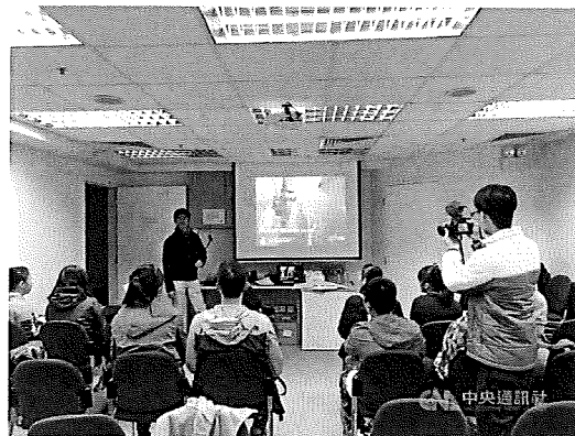
澎湖縣海國中師生去年以「進舟追夢 揚帆鎮海」為主軸，成功贏得「小夢想·大志氣」追梦計畫，24日啟程香港展開第一階段帆船訓練課程，（吳憶如提供）中央社 108年2月24日