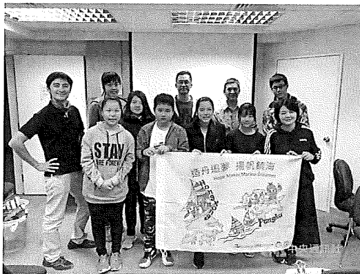
全校僅20名學生的澎湖縣鎮海國中，去年以「進舟追夢 揚帆鎮海」為主軸贏得「小夢想·大志氣」追梦計畫，24日一行人抵達香港，展開訓練課程。108年2月24日