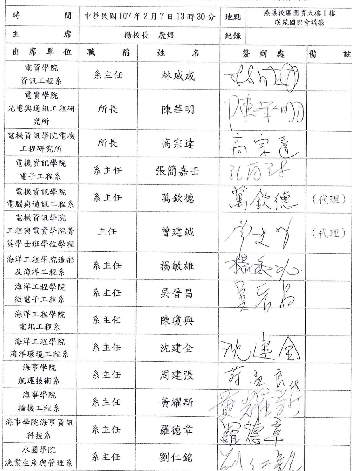
國立高雄科技大學 106 學年度第 1 次行政會議出席人員簽到表